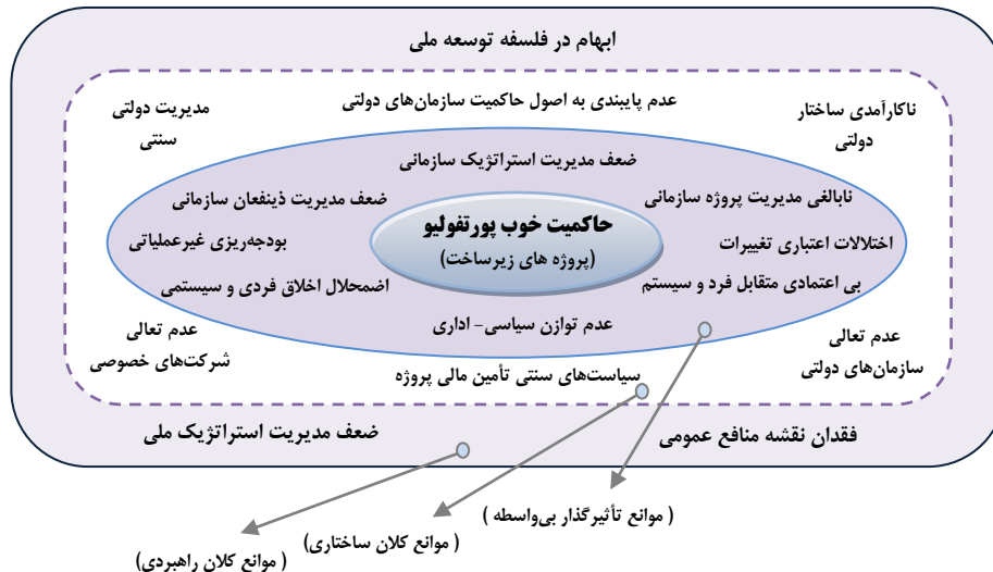
شکل ۳ الگوی ساختاری موانع حاکمیت خوب پورتفولیوی پروژه‌های زیرساخت راه کشور

راهکارهایی متناسب با هر سطح می‌باشد. به منظور درک این ساختار، موانع واکاوی شده در این پژوهش در قالب یک الگوی ساختاری سه سطحی ترسیم شده است (شکل ۳).